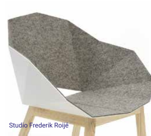
Studio Frederik Roijé

Gebruiksgemak, ontwerp, materiaalkeuze en uitvoering worden optimaal op elkaar afgestemd. Uiteraard zorgen wij ervoor dat we de gewenste eigenheid en karakter kunnen geven aan het product en/of project!